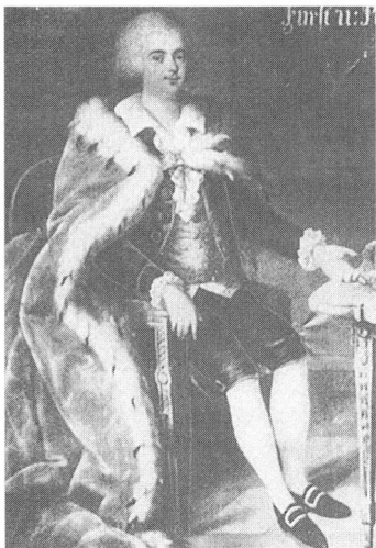
Fürst Franz Seraphin

Im Jahr 1786 wird aber auch das Kloster in Unterhaus im Zusammenhang der kirchlichen Reformen Josefs II. aufgehoben. Davon betroffen waren alle "beschaulichen Klöster", soweit sie nicht Nutzen brachten.